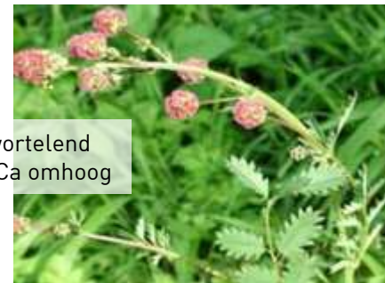
Diep wortelend Haalt Ca omhoog