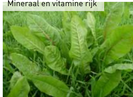
Wekt eetlust op Mineraal en vitamine rijk