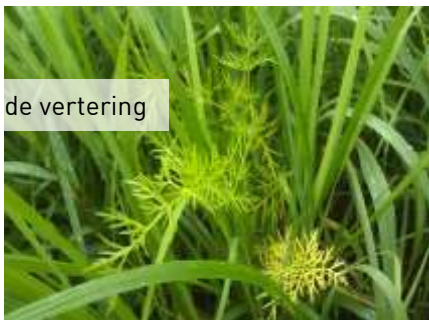
Helpt de vertering